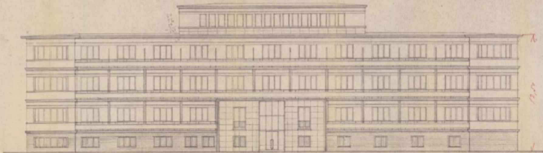
MUNKÁCSY UTCAI HOMLOKZAT