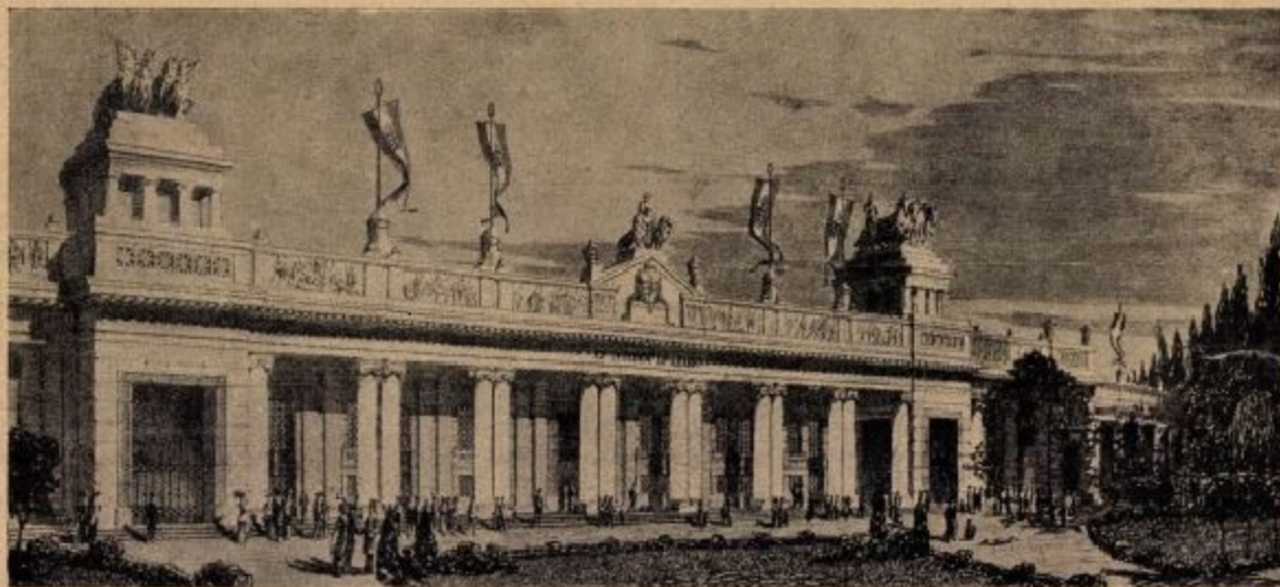
A stadion homlokzata.

Amióta a sport gyökeret vert Magyarországon és általános népszerűsége emelkedett, forró vágya volt az egész sporttársadalomnak a magyar stadion. Tisztában volt minden intelligens ember annak rendkívüli nagy kulturális jelentőségével, meggyőzött arról mindenkit a klasszikus kor és a modern kor történelme is. Ami a hívőknek a