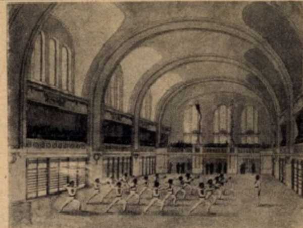
Az akadémia tornaesernoka, amely legnagyobb a világon.

tek nagyszerű modern stadionokat. A magyar sport nagy fejlődése, ami közönségünknek a sport iránti nagy szeretete, mindinkább aktuálissá tették a magyar stadion megteremtését, amelyre vonatkozólag döntő impulzus volt az a hír, hogy 1920-ban esetleg Budapesten rendeznék az olimpiádot. Felsőbb biztatásra az első magyar olimpiai bajnok, Hajós Alfréd, műépítész társával, Villányi Jánossal együttesen a legnagyobb csendben elkészítette a magyar stadion tervezetét, melyet a miniszterium a most alakult Országos Testnevelési Tanács elé utalt. Oszlatlan nagy tetszésre talált itt e nagyszerű alkotás, amely a világ legtökéletesebb stadionját tárja elének. A stadionnal kapcsolatosan épül föl a jövő legfontosabb testnevelési hajléka, a Testnevelési Akadémia (tornatanár-képző intézet) és az annyira óhajtott százméteres uszoda is. A magyar stadion nemcsak az országos és világversenyek színhelye lesz, hanem otthona lesz az a tömegszínházok, szimfonikus hang-