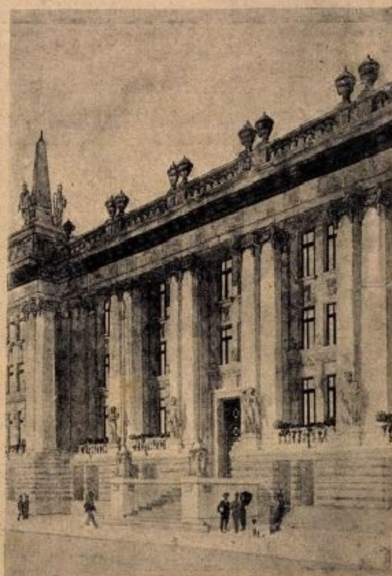
A Testnevelési Akadémia főbejárata.