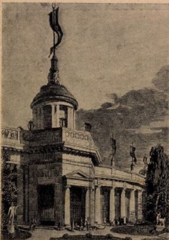
A stadion árkádja.

templom, az a testedzés híveinek a stadion. Kevés nemzet büszkélkedhetik ilyenekkel, mert annak megteremtése igen nagy pénzüldozatot kíván. Az első olimpiádok színhelye, Athén szolgált mintával a klasszikus időből fennmaradt és modernizált stadionjával, amelynek nyomán Londonban, St.-Louisban, Stockholmban és legutóbb Berlinben építet-