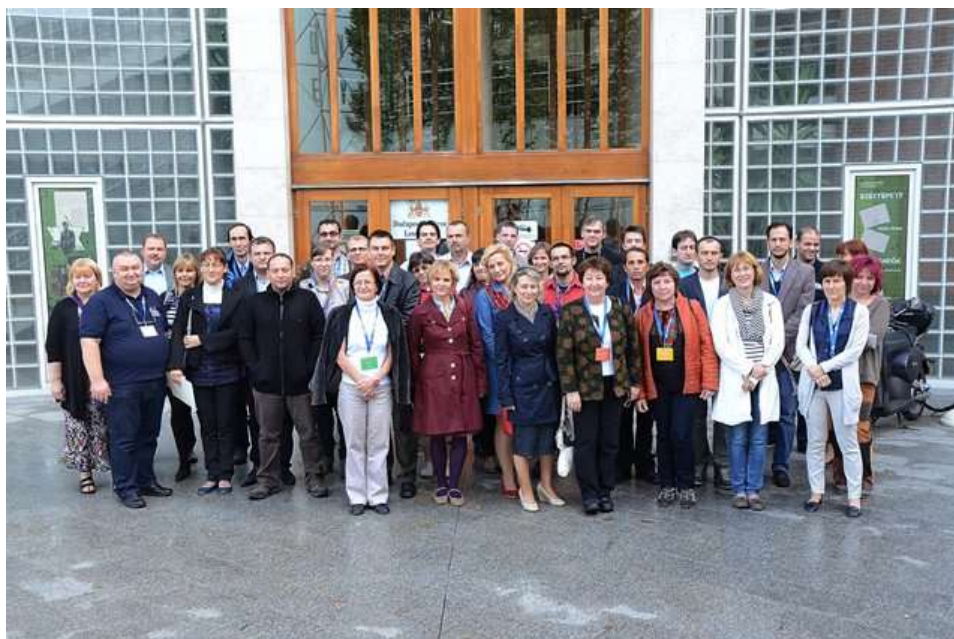
A képzés résztvevői a BFL épülete előtt

A gyakorlati képzést az összes csoport számára közösen tartott elméleti oktatás előzte meg, ahol három kollégánk tartott előadást az adatbázis-építés, SDB, OCR, digitális állományok archiválása és mentése, ki publikálás témákban. A csoportok irányítását, mozgását a különböző színű programfüzetek segítették, amelyekben megtalálhatták a beosztásukat és a képzés helyét. A képzésen szerzett tudás megőrzésére a kollégák számára egy 44 oldalas oktatási segédanyagot készítettünk, amely a gyakorlati foglalkozáson elhangzottak írásbeli összefoglalását tartalmazza. A résztvevők a kurzus befejeztével tanúsítványt kaptak a képzés elvégzéséről. A továbbképzés mind szakmai, mind pedig a levéltárközi kapcsolatok szempontjából sikeresnek tekinthető, lehetőséget adott