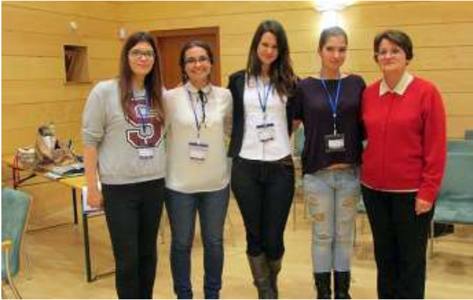
A győztes csapat: a Kispesti Károlyi Mihály Magyar-Spanyol Tannyelvű Gimnázium Harci Csivák nevű csapata, felkészítő tanárunkkal